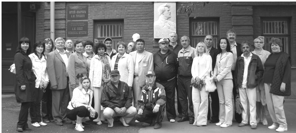
(Окончание. Начало на стр.1)