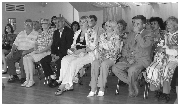
В Доме дружбы Татарстана.