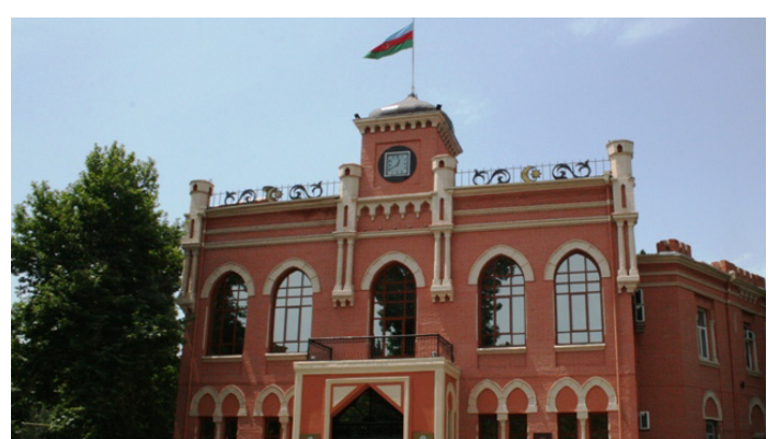
Здание Национального Совета в Гяндже