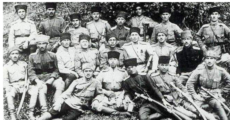
Офицеры армии АДР

В то же время, в середине апреля, части 11-й Армии РККА, разбив остатки войск Деникина, подошли к северным границам Азербайджана. Воспользовавшись тем, что Азербайджан перевосил практически все свои войска в Карабах, 27 апреля части 11-й Армии перешли азербайджанскую границу и, не встретив существенного сопротивления, 28 апреля вошли в Баку. АДР прекратила существование, и была создана Азербайджанская Советская Социалистическая Республика.