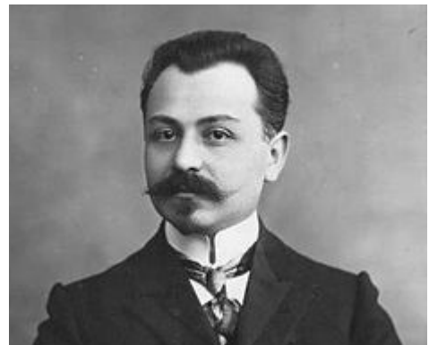
Фатали хан Хойский

торому было поручено сформировать первое правительство АДР, объявил его состав: