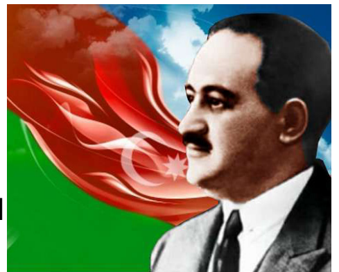
Мамед Эмин Расулзаде

Политическое положение в Азербайджане усугублялось в значительной степени также и с её попытками установить свою власть над территориями Карабаха, Зангезура и