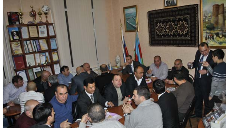
Чаепитие в офисе ЛАСО.

Принято считать, что мугам – это прежде всего импровизация. Это так и не так. В двадцатом