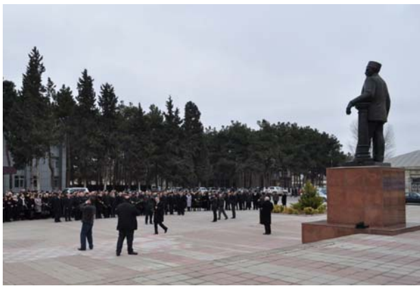
Сальянцы празднуют юбилей своего великого земляка.

Также отмечается, что автором трёхцветного флага Азербайджанской Демократической Республики (ставшего позднее и флагом Азербайджанской Республики) был именно Али-бек Гусейнзаде.