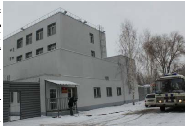
Центр временного содержания иностранных граждан в Тольятти.