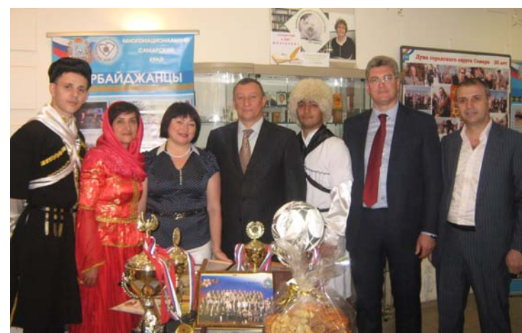
Выставка ЛАСО, приуроченная к заседанию Общественного Совета.