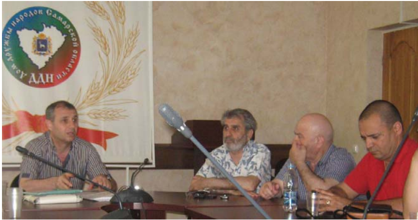
24 мая 2014 г. В Доме дружбы народов состоялось собрание членов Правления и активистов «Лиги азербайджанцев Самарской области».